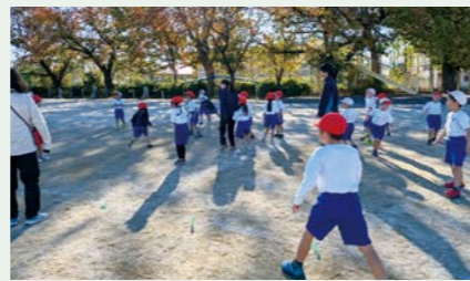
小高連携事業 近隣の小学校のホームルームクラスに参加し、小学生の学習をサポートします。