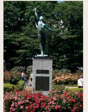
与野公園(シンボル像)