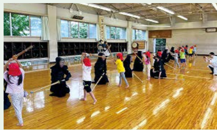
剣道部 10月に近隣の保育園と剣道体験の交流をしています。