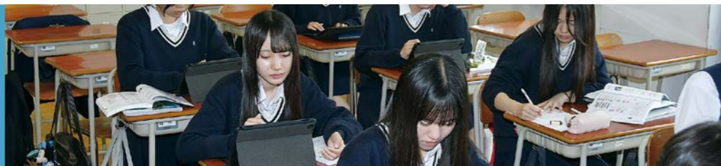
各科目の数字は単位数（1週間に授業をする時間数）