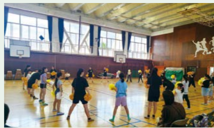
バトン部 「夏休み子どもカレッジ」に参加をして、市内の小学生とチャアリーディングを楽しみました。